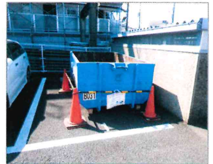
設置位置及び設置例